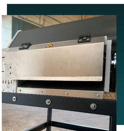
TRAPPE DE SORTIE