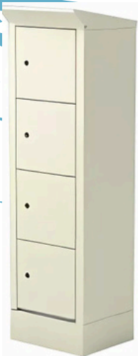
RAL 7035 / RAL 7035 Réf .495