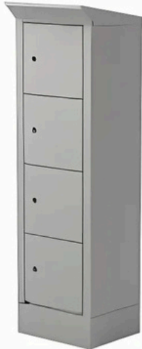
RAL 9006 / RAL 9006 Réf .497