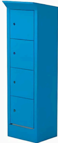
RAL 5012 / RAL 5012 Réf .494