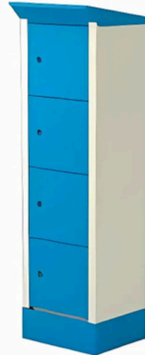
RAL 7035 / RAL 5012 Réf .498