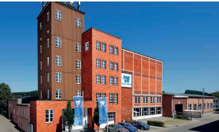
Le bâtiment principal en Wangen, Allemagne

Le nom de WANGEN PUMPEN est originaire de Wangen, dans la région de l'Allgäu en Allemagne, qui est le siège social et le site de production principal de l'entreprise. C'est notre région d'origine, dans le sud de l'Allemagne où les trois pays, l'Autriche, la Suisse et l'Allemagne, se rassemblent au lac de Constance.