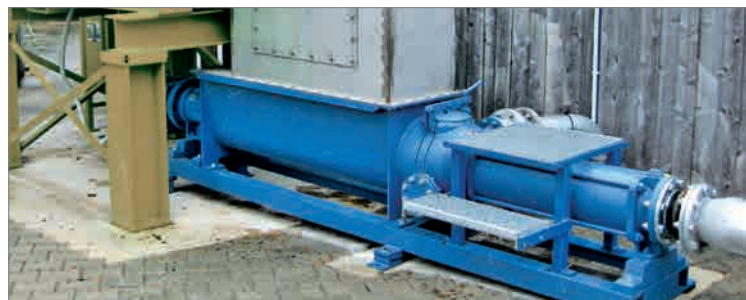
Dépôt de produits solides à destination du broyeur