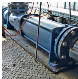
Convoyage de substrat entre les digesteurs