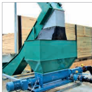
Alimentation de la pompe via une trémie de versement

La tâche des pompes dans les installations de biogaz est le transport de substrats épais entre les digesteurs. Nous proposons divers types de pompes selon le substrat à convoyer et l'installation de biogaz concernée. Notre expérience acquise depuis de nombreuses années nous permet de développer des concepts pratiques.